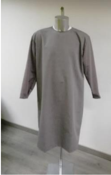
Md 172 DE voorkant overschort

Overschorten met drukknoopsluiting op de rug, wasbaar op 95°C.