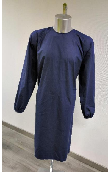
Md 172 DH voorkant