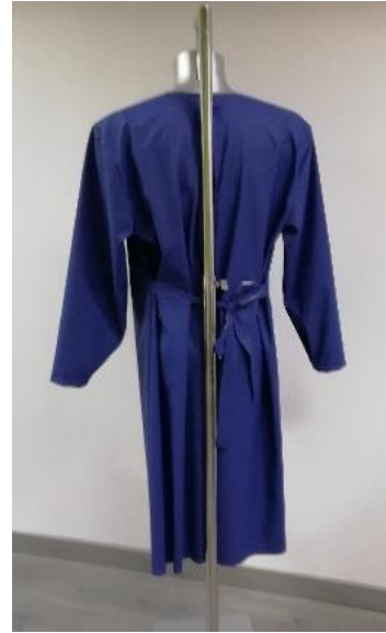
rug met drukknoopen en bindlint